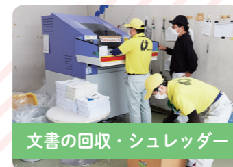
文書の回収・シュレッダー

心を込めて清掃するととても きれいになるので、やりがい があります。毎日出社したくなる ほど、雰囲気も楽しく楽いで す。通常の休みだけでなく、誕 生日休暇や年3回の長期休暇 がとれることも魅力です。