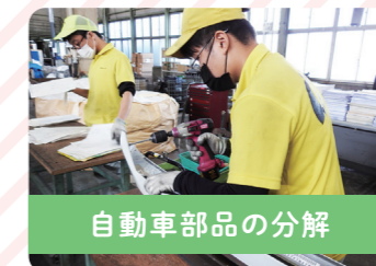
自動車部品の分解