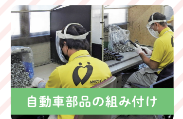
自動車部品の組み付け